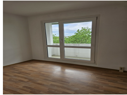
Wohnzimmer mit Balkon